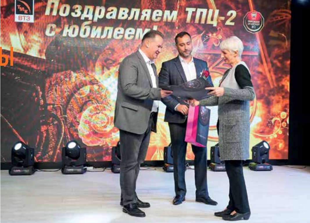
↑ К 35-летию ТПЦ-2 в коллективе наградили передовиков производства