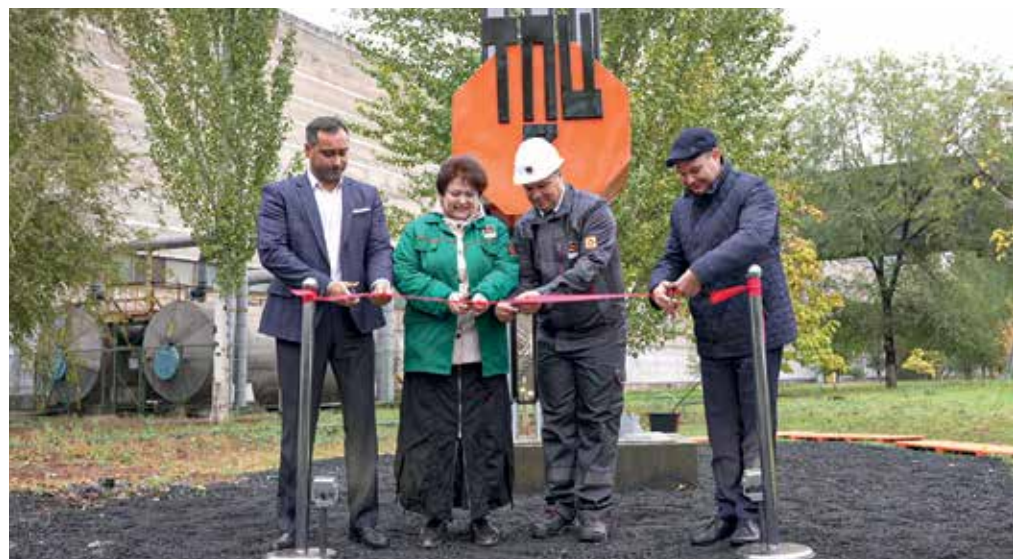
↑ После реставрации была открыта памятная стена, изготовленная первыми работниками цеха