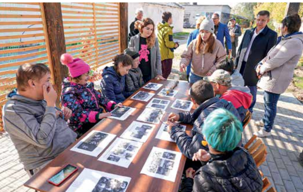
↑ Первое занятие для детей на новой площадке «Аптекарского огорода» было посвящено знакомству с лечебными растениями

ВТЗ выступил партнером социального проекта «Мир открытых возможностей» Волжского общественного благотворительного фонда «Дети в беде». Завод оказал помощь в реализации нового направления трудовой социализации и психологической реабилитации молодых людей с ментальными нарушениями «Аптекарский огород».